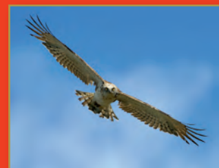
Le circaète Jean-le-Blanc.