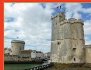
Les tours de La Rochelle